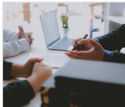
Trámites de sepelio y Asesoría