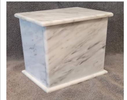
Urna de mármol**