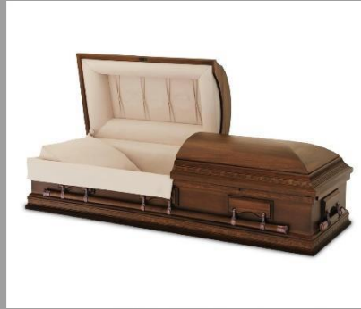
Ataúd de Madera Imperial o similar**